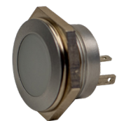
EH-SMFE22214 Duo-LED - zweifarbig (Rot / Grün) TKZ: 21105