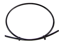
EH-LHDC-105°C-2 Brandmeldekabel 105 °C, 2 polig TKZ: 50460